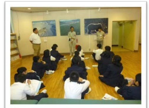
＜指導員に質問する生徒たち＞

＜レッサーパンダ（左） ニホンザル山（中央） カワウソ（右）などの 市動物園の人気者＞ ※見えづらいですが