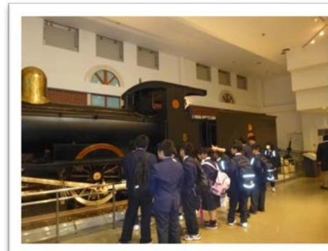
＜SLの説明を熱心に聞く生徒たち＞

二日目も午前中雨が降ってきてしまいましたが、2人の指導員の説明を聞きながら、大町自然公園で自然観察ができました。昼食後、やっと晴れ間が出て動物園で班別行動ができました。電車内のマナーや公道を歩くマナーなど仲間とともに学び、宿泊することで、より一層友人との絆が深まりました。学校へ帰ってからもこの経験を生かして生活してほしいと思います。